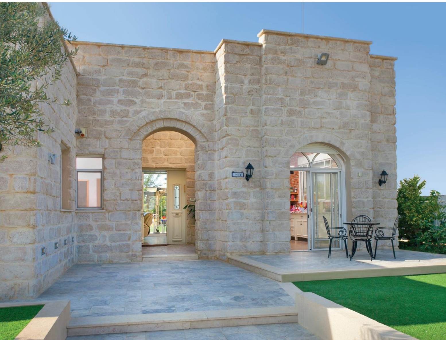
אבן לחיפוי דגם 'ענתיק' גוון כורכרי, 'אקרשטיין HOME', אדריכלות: רון ושורית פלד