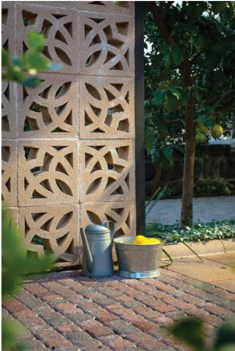
משרבייה דגם רקפת 6 גוון כורכרי. ריצוף באבן רמות בגימור 'ענתיק' בגוון אדום עתיק.

אבן גירית קיימת בהרי ירושלים והצפון. בגליל ניתן גם למצוא אבן בזלת ובאזור השפלה והחוף נמצא הכורכר, אולם גם הכמות של אוצרות אלה מוגבלת, ובכדי לשמור על הקיים חל איסור על כרייתם למטרות בנייה