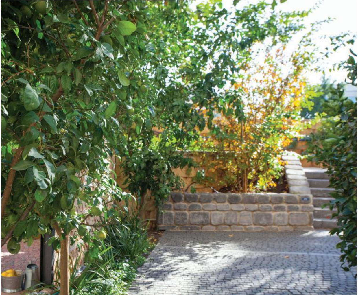
ריצוף באבן דגם "פורטו" בגוון שחור בזלתי, אבן לחיפוי דגם 'ענתיקו' בגוון שחור בזלתי, 'אקרשטיין HOME'

הפתרון נמצא בחברת 'אקרשטיין HOME', המתמחה בייצור אלמנטים לבנייה פרטית העשויים מאגרנטים טבעיים. בין יתר המוצרים החדשים הנראים ומרגישים בדיוק כמו אבן טבעית, בולטים הכורכר והבזלת